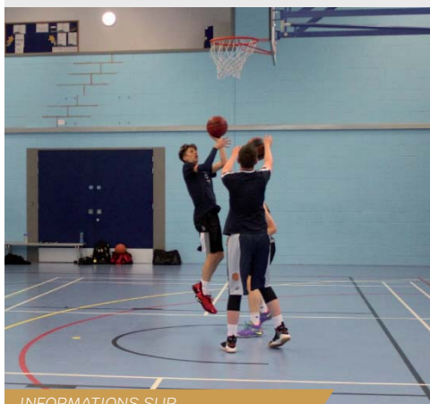
INFORMATIONS SUR FACEBOOK - ST VINCENT DE BOISSET

Fermée depuis le mois de mars en raison de la Covid-19, la salle de sports accueille de nouveau les sportifs vincentinois et boscois depuis le lundi 24 août. Bien évidemment, des conditions drastiques ont été imposées aux utilisateurs, en cohérence avec les directives du ministère des sports : pas d'accès aux vestiaires et aux douches, sens de circulation, absence de buvette, tenue d'un registre des présents. Le syndicat gestionnaire assure un nettoyage et une désinfection systématique des lieux.