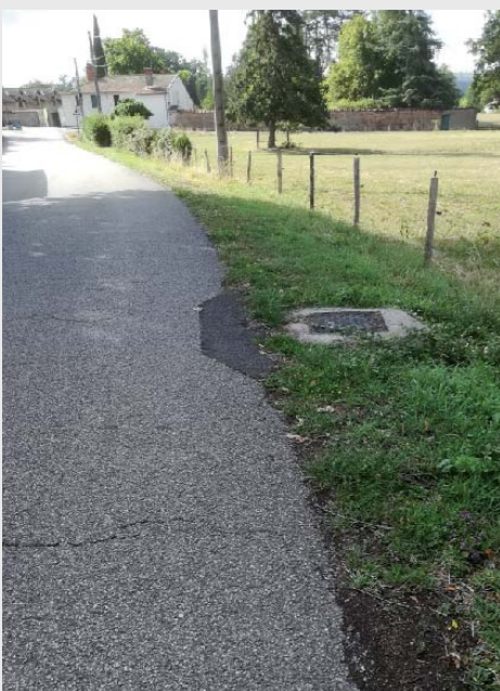
INFORMATIONS SUR FACEBOOK - ST VINCENT DE BOISSET

Plusieurs petits chantiers visant à améliorer la sécurité de la voirie sur la commune ont été réalisés cet été par les services techniques. Des regards ont été rebouchés ou réparés sur plusieurs chemins afin de limiter les risques d'accident pour les piétons. Plusieurs avaloirs ou grilles d'égout ont été changés. Une tranchée présentant un danger manifeste pour les véhicules a été busée et refermée sur le chemin. Enfin, un travail est mené par les élus pour sécuriser certaines zones présentant un risque manifeste en bord de voirie.