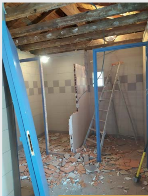
INFORMATIONS SUR FACEBOOK - ST VINCENT DE BOISSET

Le choix a été fait par l'ancienne municipalité, validé et concrétisé par les nouveaux élus, de proposer des toilettes accessibles aux personnes à mobilité réduite. Ce projet s'inscrit dans le cadre de l'Agenda d'Accessibilité Programmée (ADAP) de la commune.