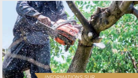
INFORMATIONS SUR FACEBOOK - ST VINCENT DE BOISSET

La municipalité a fait procéder cet été à l'abattage de 6 arbres morts qui menaçaient la sécurité des piétons ou des véhicules, étant tous situés en bord de routes ou de chemins. Les élus sont, cette année, très attentifs aux risques liés aux arbres ou aux branches mortes, la sécheresse ayant rendu certains très fragiles.